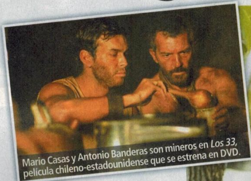
Mario Casas y Antonio Banderas son mineros en Los 33 , película chileno-estadounidense que se estrena en DVD.