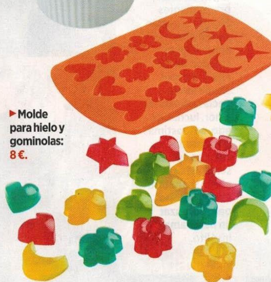
► Molde para hielo y gominolas: 8 €.

UTENSILIOS DE COCINA Agatha Ruiz de la Prada se ha unido con Lékúé para crear una colorida y divertida línea de cocina que incluye moldes para tartas, cupcakes y gominolas, espátulas de silicona... ¡todo lo que te puedas imaginar!