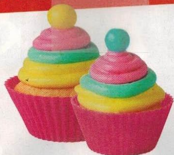
▲ Para hacer magdalenas: 8 €.