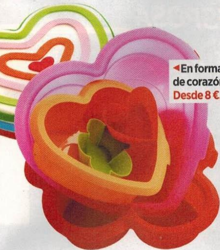
◀ En forma de corazón: Desde 8 €.